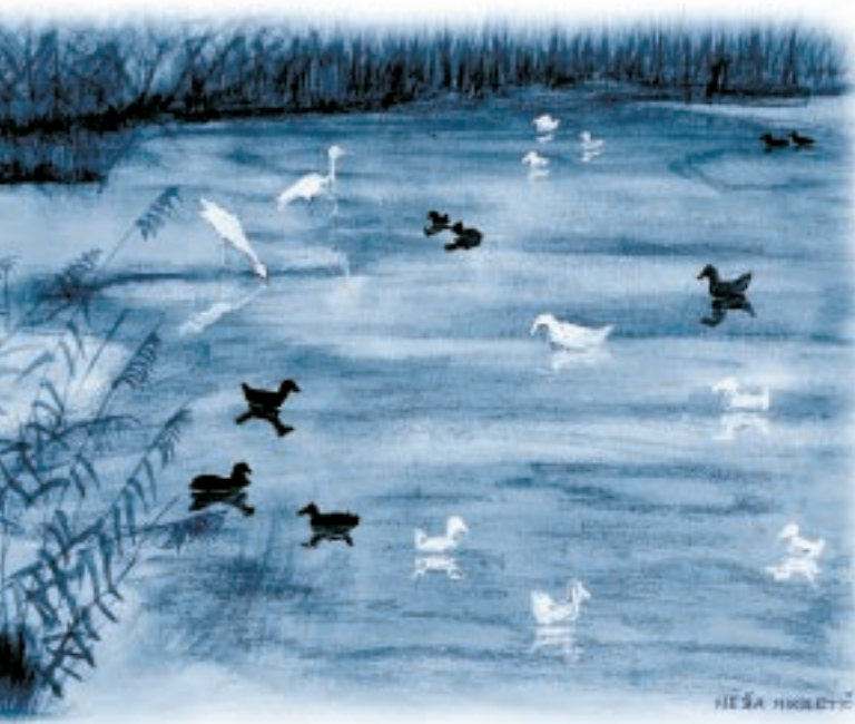
risba: Neža Mikuletič

Spet bi poglobila dno. Del Rižane bi preusmerila nazaj v zatok. Uredila bi kanalizacijo in očistila odpadke.