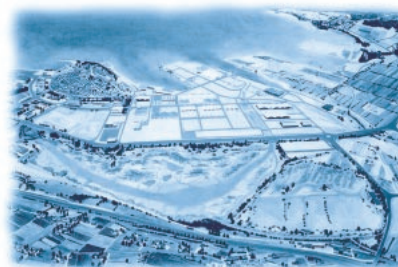
panoramska risba: Damijan Jerič

Nataša Šalaja in Borut Mozetič Društvo za opazovanje in proučevanje ptic Slovenije - DOPPS